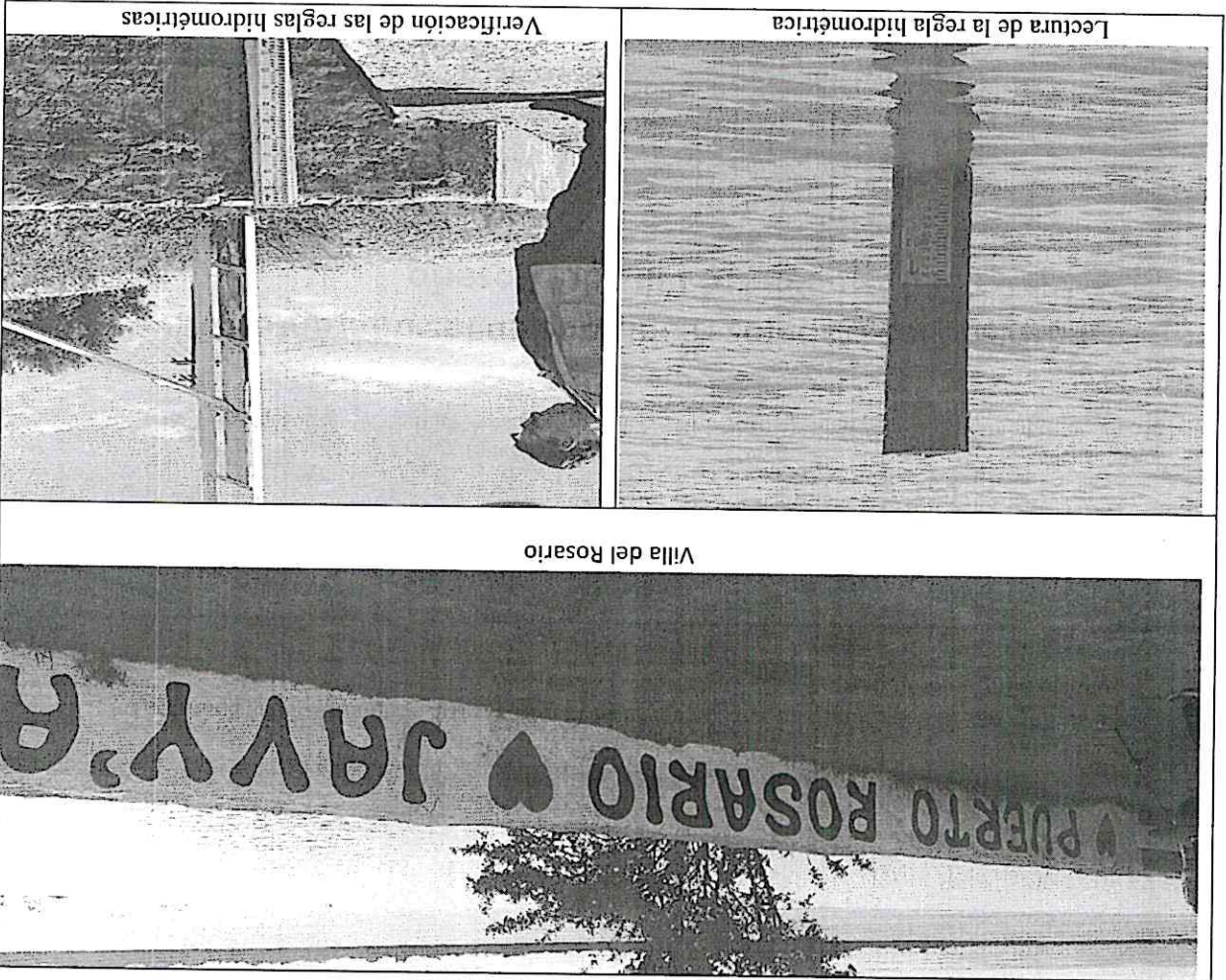
Fotos de los trabajos realizados en los diferentes sitios Puerto Villa del Rosario

[Handwritten signatures and a large number '6']